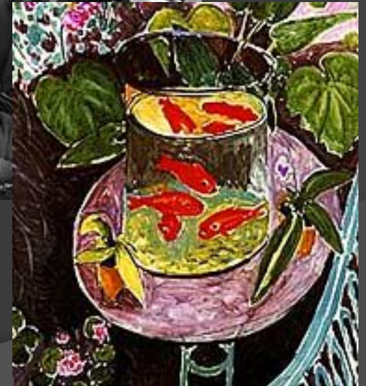
А. МАТИСС «КРАСНЫЕ РЫБКИ»