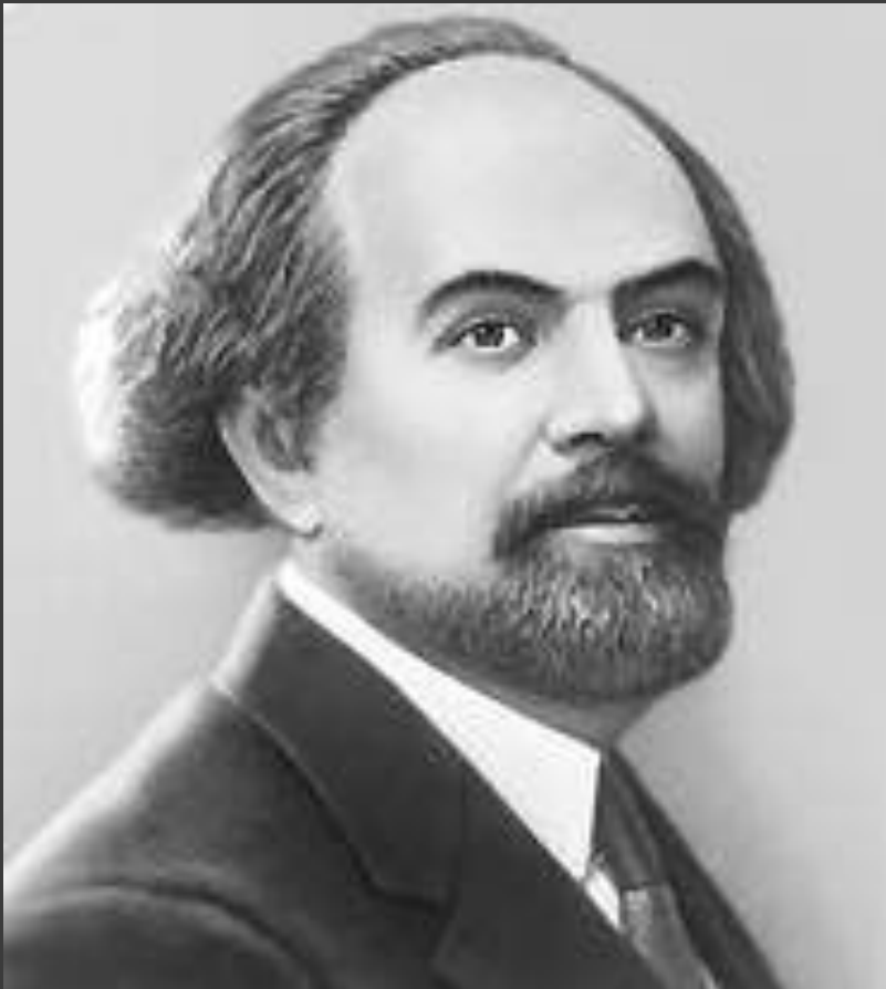
Бердяев Н.А. «Конец Европы»

Первые десятилетия XX в. – ощущения кризиса и распада окружающего мира.