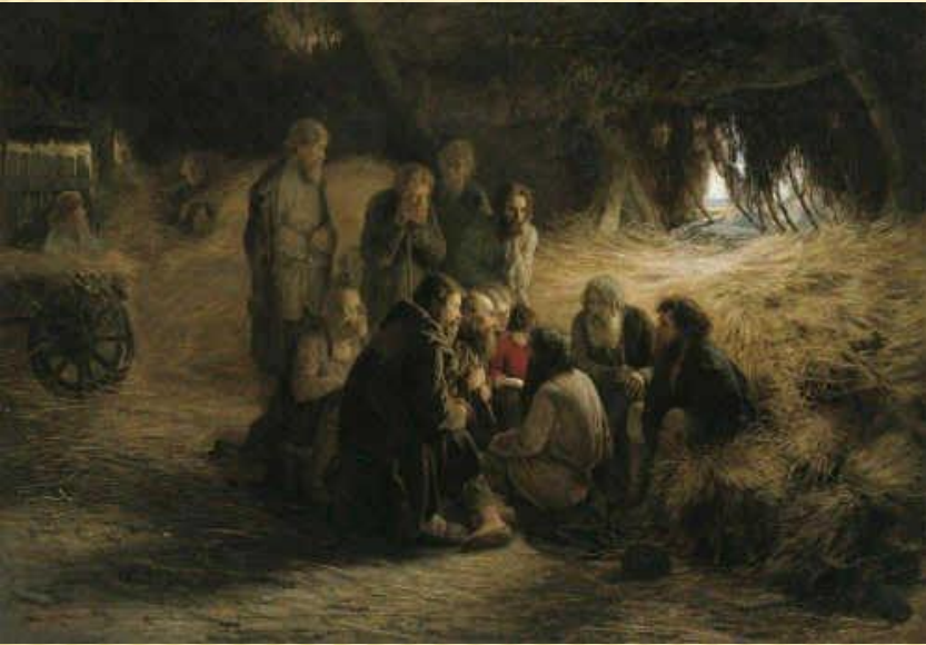
Г. Мясоєдов. Читання Положення 19 лютого 1861 року.