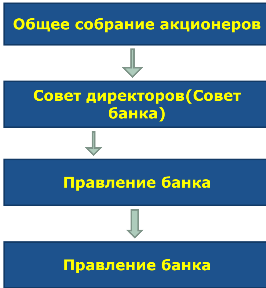
Схема управления банком