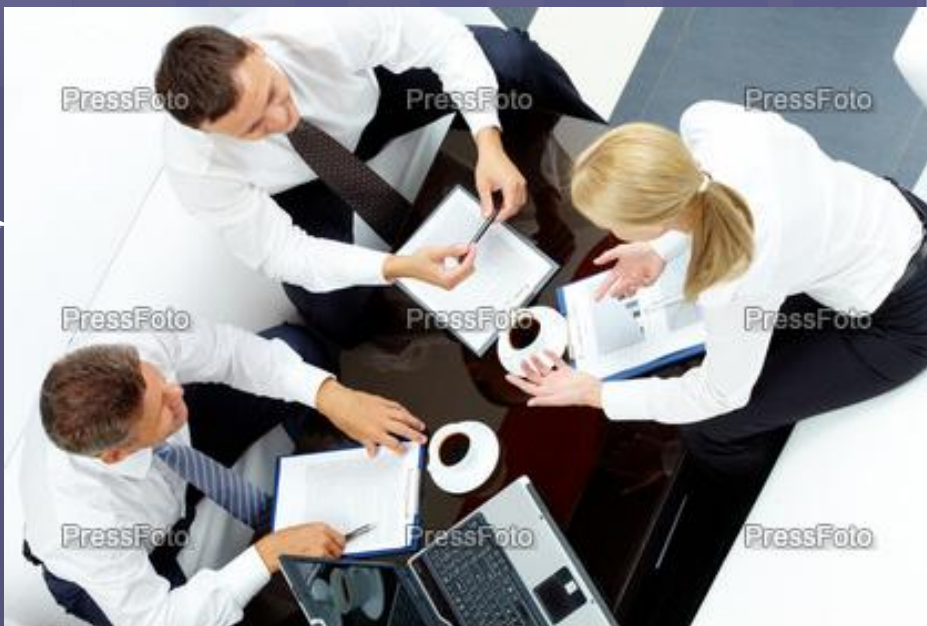
Использование этого изображения законно только после его покупки www.pressfoto.ru · #485740

Общаться можно в разной обстановке, это не обязательно тугой галстук на шею и серьезные лица!