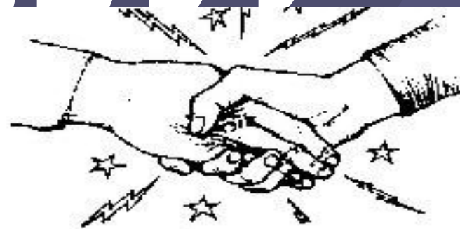
Чрезмерно сильное - костедробящее рукопожатие