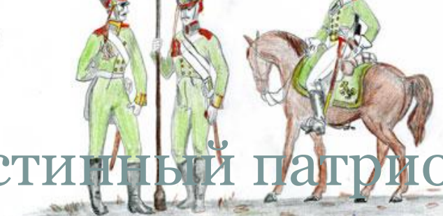
Унтер-офицер, лейтенант пехоты артиллерии. рядовой канонир пехоты артиллерии