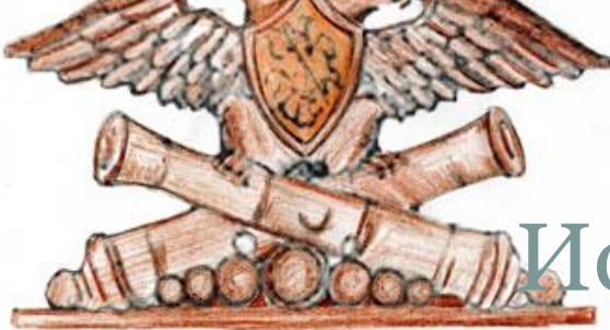
Знак Главной артиллерии.