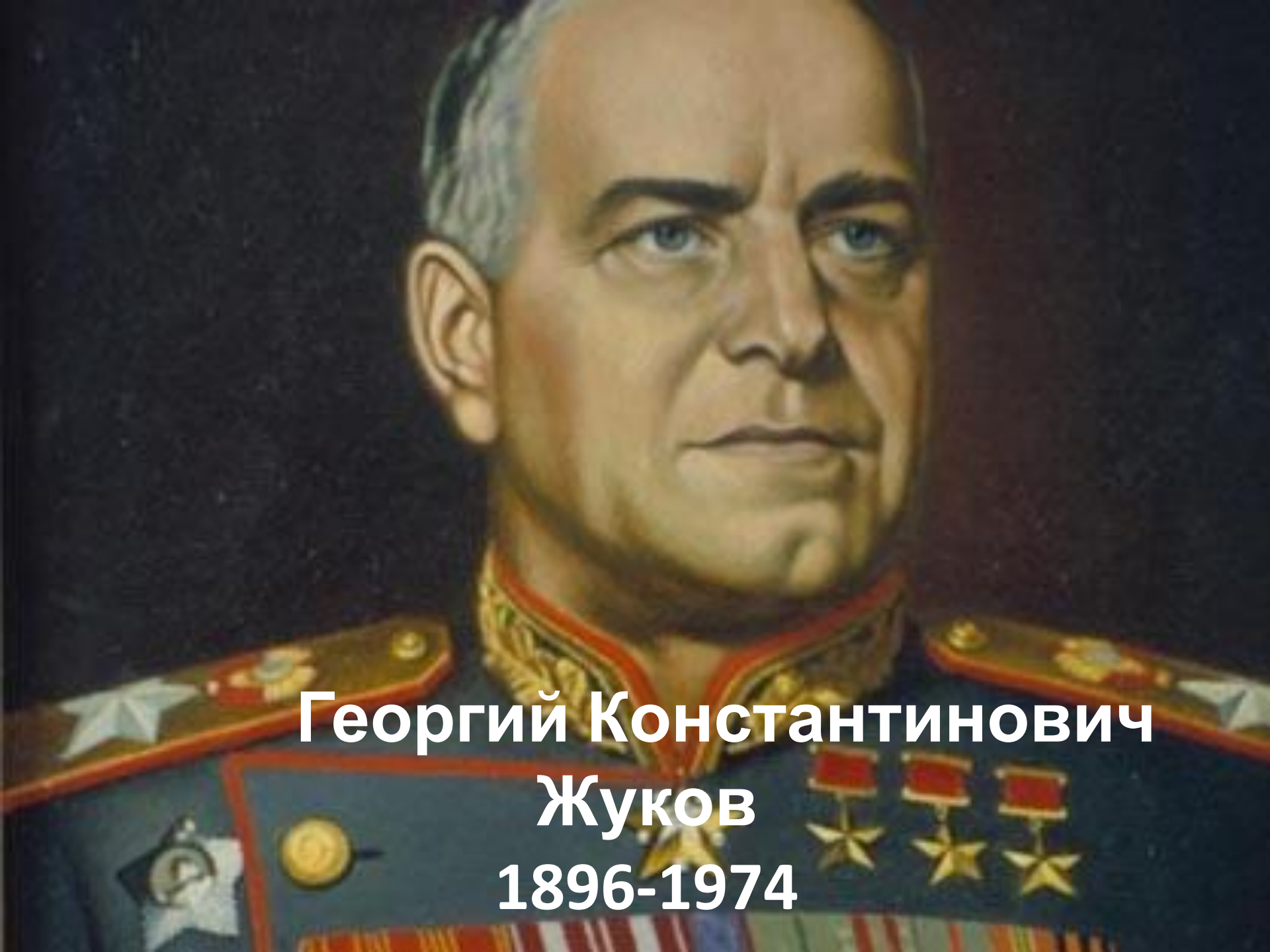
Георгий Константинович Жуков 1896-1974