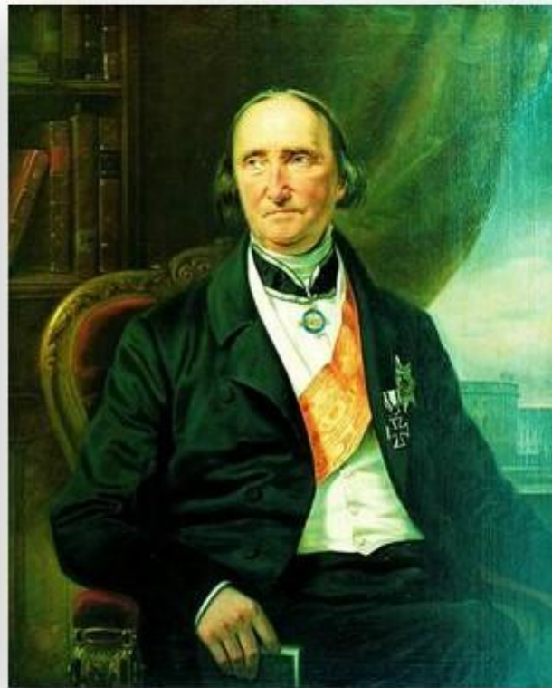
Фридрих Карл фон Савиньи