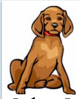
[ dɒg ]

Look at the pictures and find, who is missing?