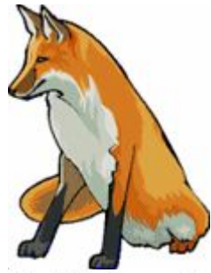
[ fɒks ]