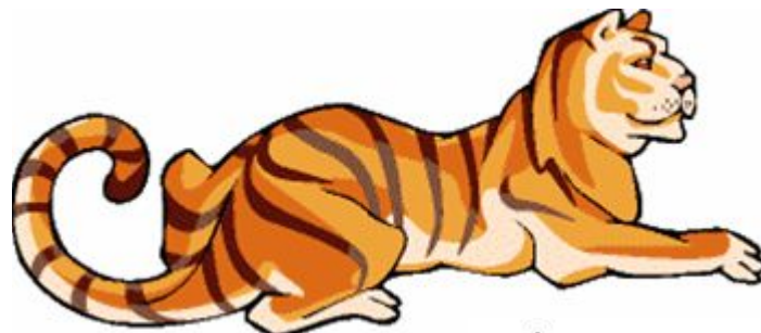
[ ˈtaɪgə ]