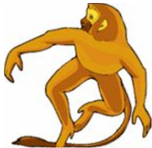
[ mʌŋki ]