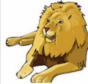
[ ˈlaɪən ]