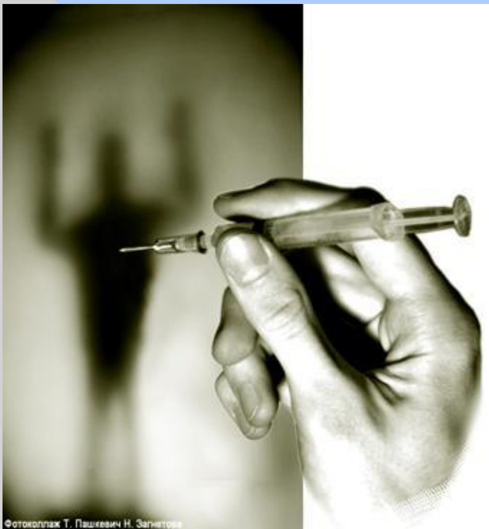
Фотоколлаж Т. Пашкевич Н. Загнетова

Какое воздействие на человека оказывает наркотик? Человек в состоянии наркотического опьянения перестает испытывать душевную и физическую боль, появляется ощущение легкости, комфорта. Ощущение легкости приводит к потере контроля над собой и утрате чувства реальности. Бывают случаи, когда человеку начинает казаться, что он может выпрыгнуть из окна и полететь по воздуху, и т. д. Состояние наркотического опьянения продолжается только в то время, когда наркотическое вещество содержится в крови.