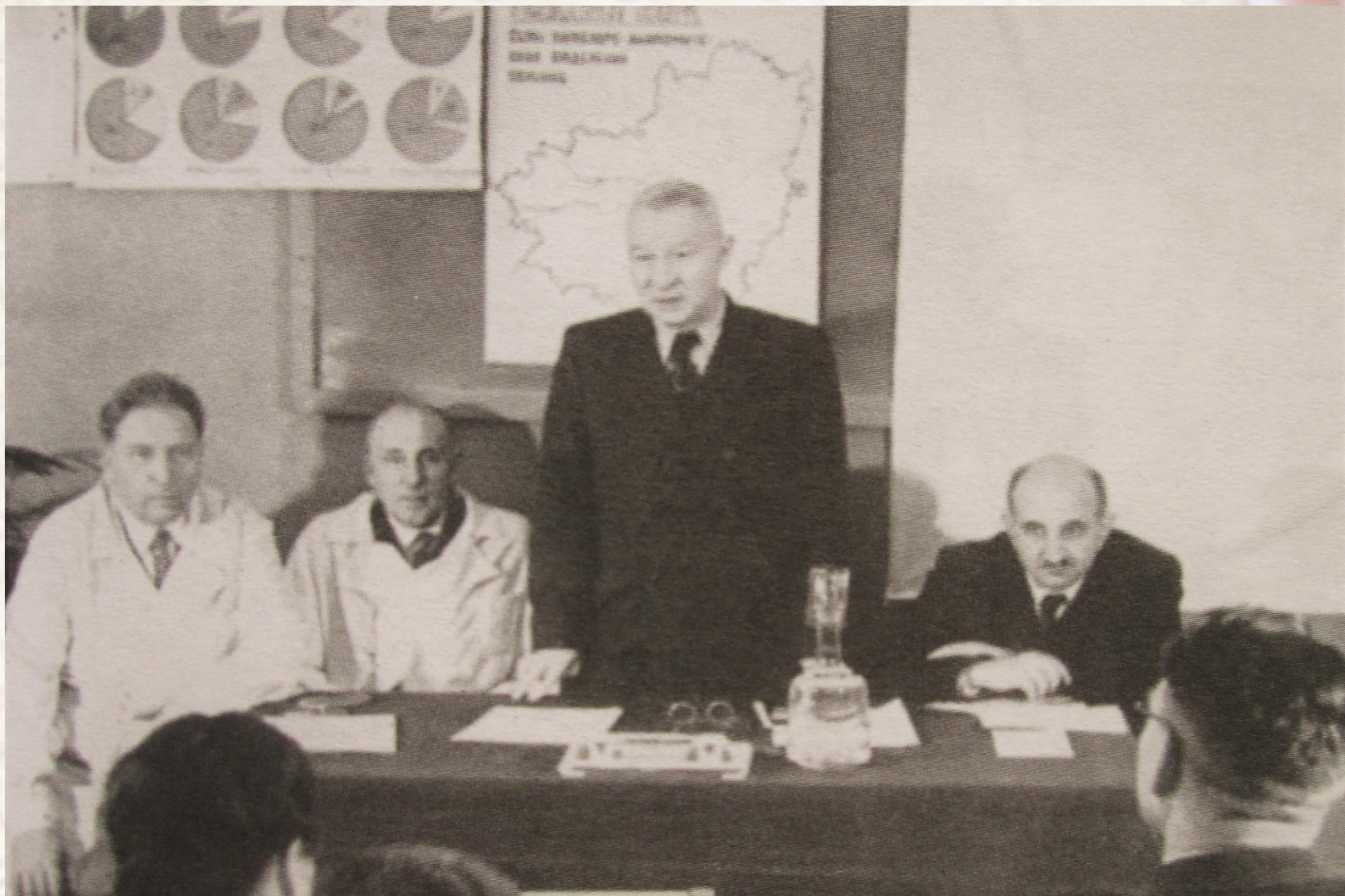
Симпозиум по изучению соединительной ткани, 1958 год