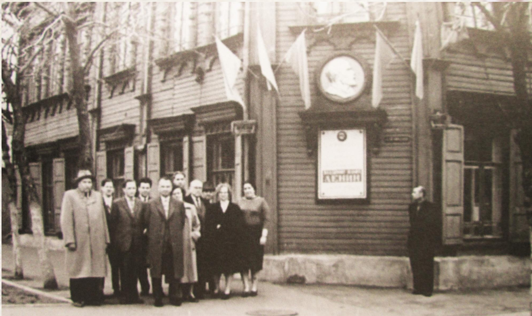
Симпозиум по компенсаторно-приспособительным процессам, 1960 год. Прогулка по городу после окончания работы симпозиума.