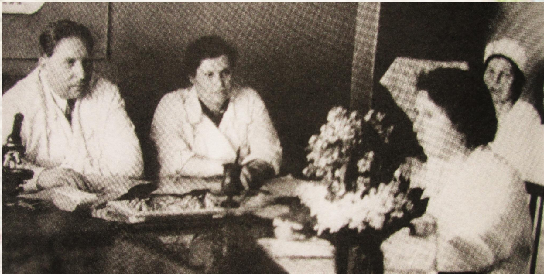
Обсуждение результатов экзамена сотрудниками кафедры. 1962-63 учебный год.