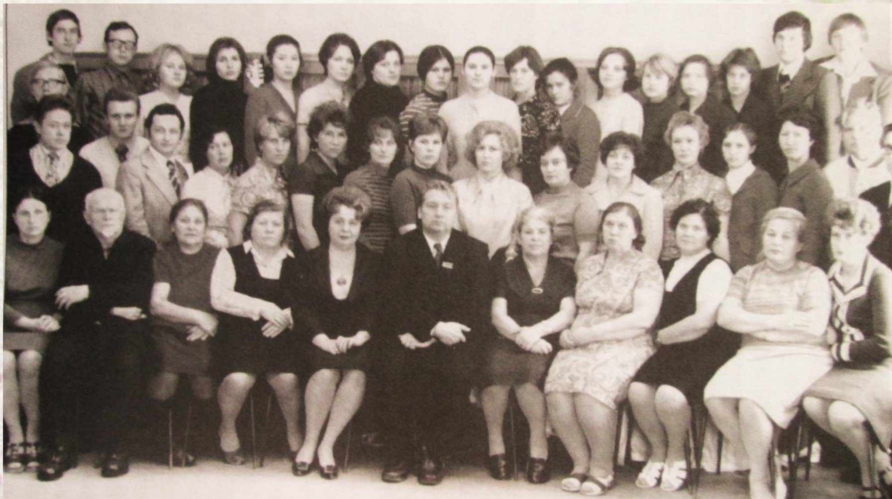
Сотрудники ЦНИЛа, 1978 год.