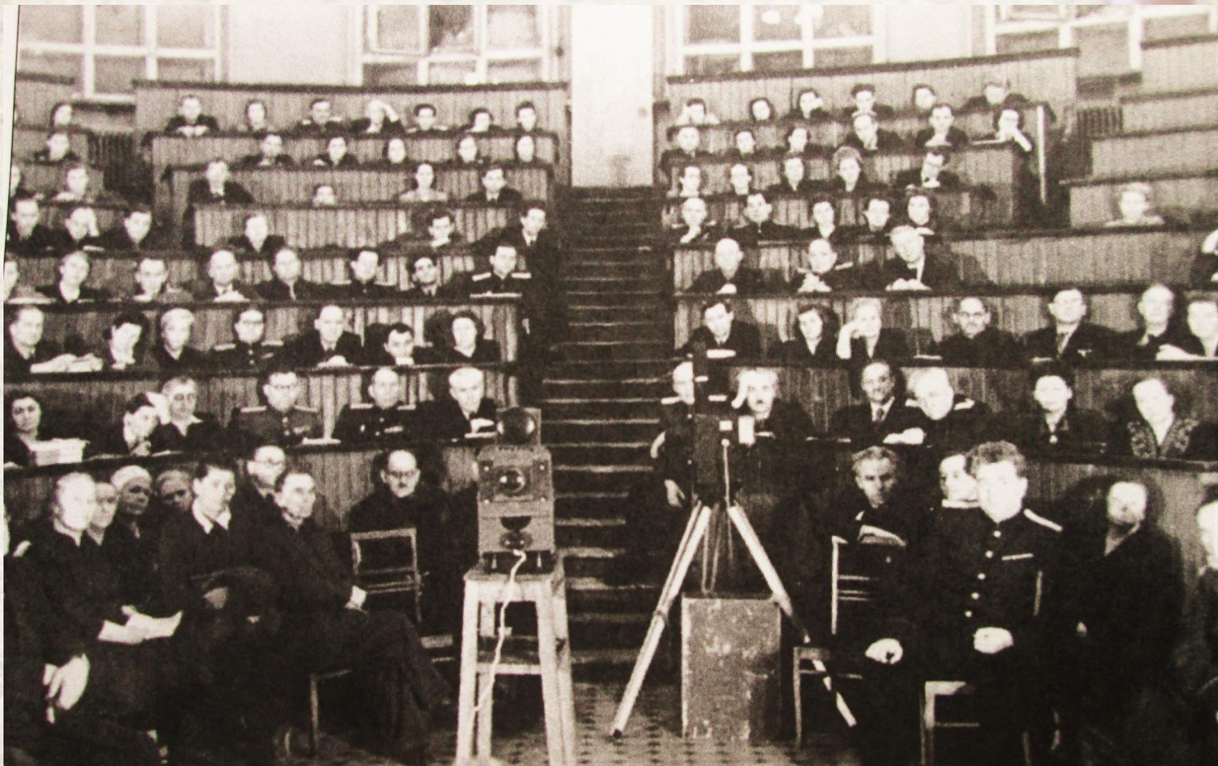
Симпозиум по изучению соединительной ткани, 1958 год