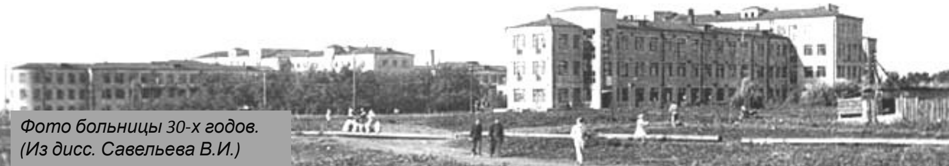
Фото больницы 30-х годов. (Из дисс. Савельева В.И.)