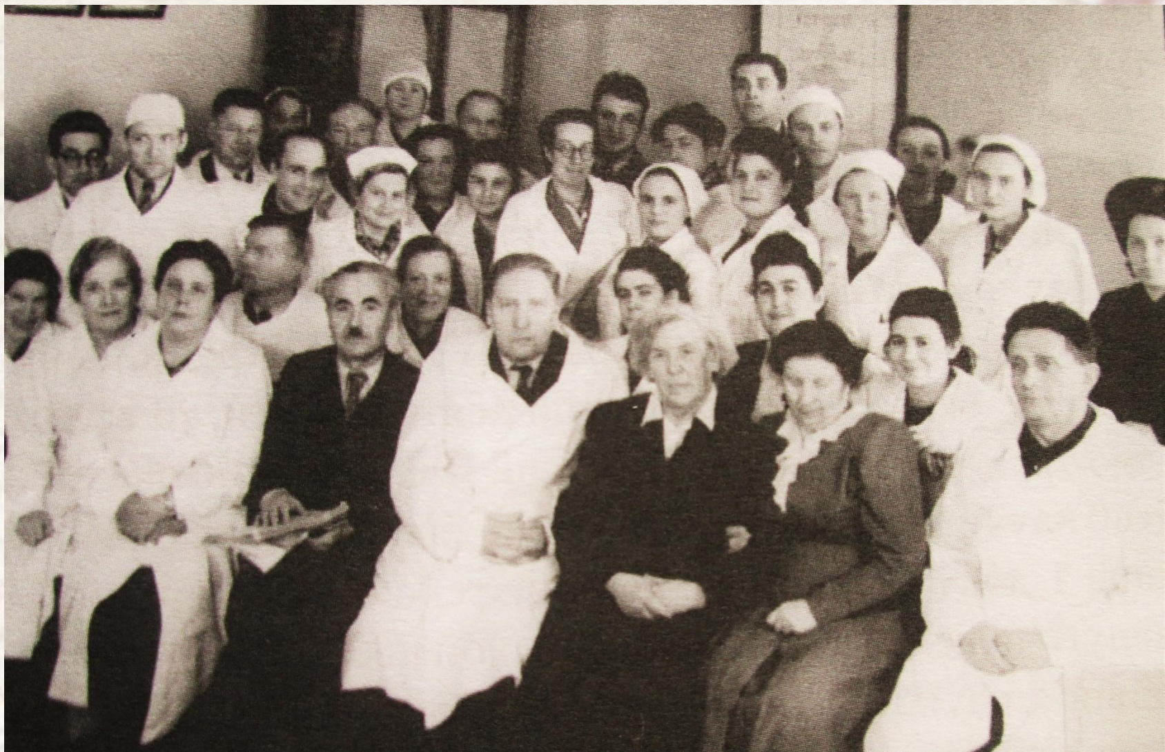
Областная и городская конференция патологоанатомов, 1954 год