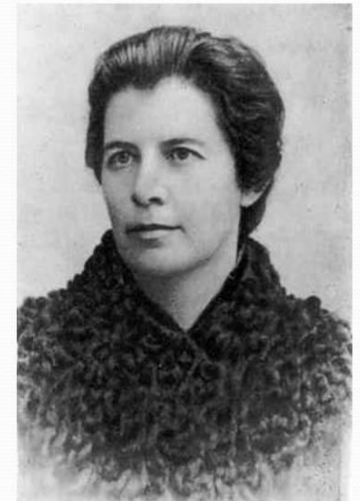
Олена Петрівна Косач (з Драгоманових), мати Лесі Українки; літературний псевдонім - Олена Пчілка. Фото 1896 р.