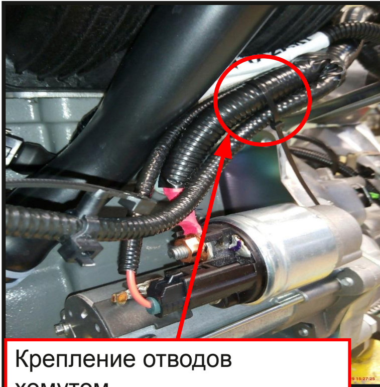
Крепление отводов хомутом.

Притянуть отвод жгута проводов двигателя на генератор к стволу отвода на стартер хомутом 7703085044 как показано на фото с разворотом остаточной длины к двигателю.