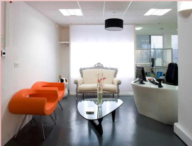
das Büro (s)