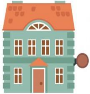
das Haus (ä, er)