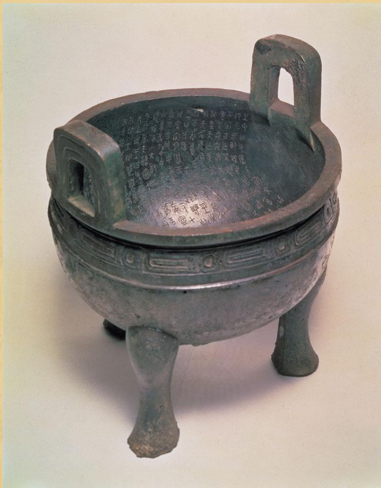
Дин 鼎 (Маогун дин 毛公鼎)