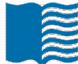
LIBRARY OF CONGRESS