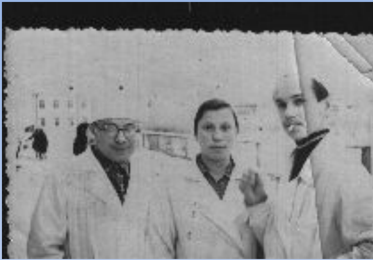
Студент Кудымкарского медучилища.