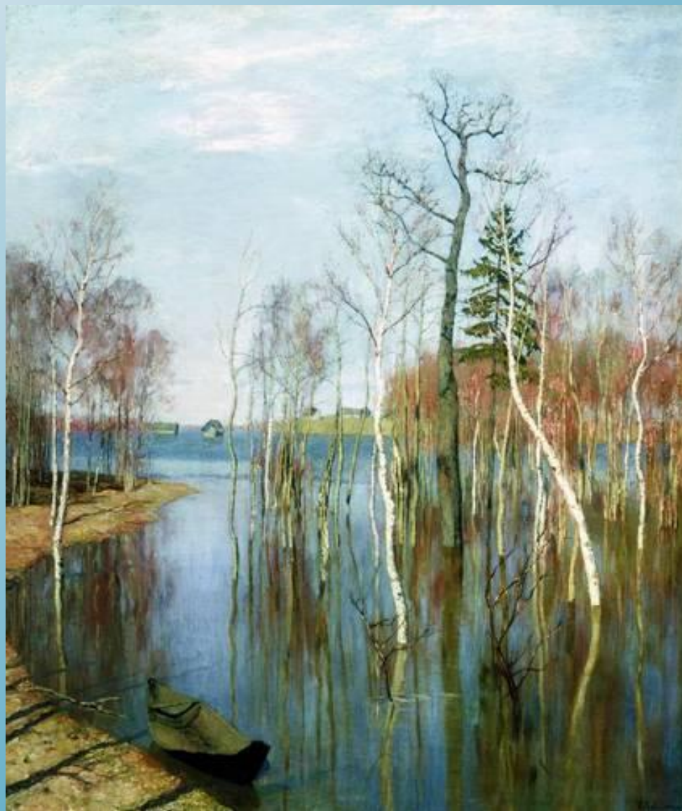
Левитан И.И Весна.Большая вода.