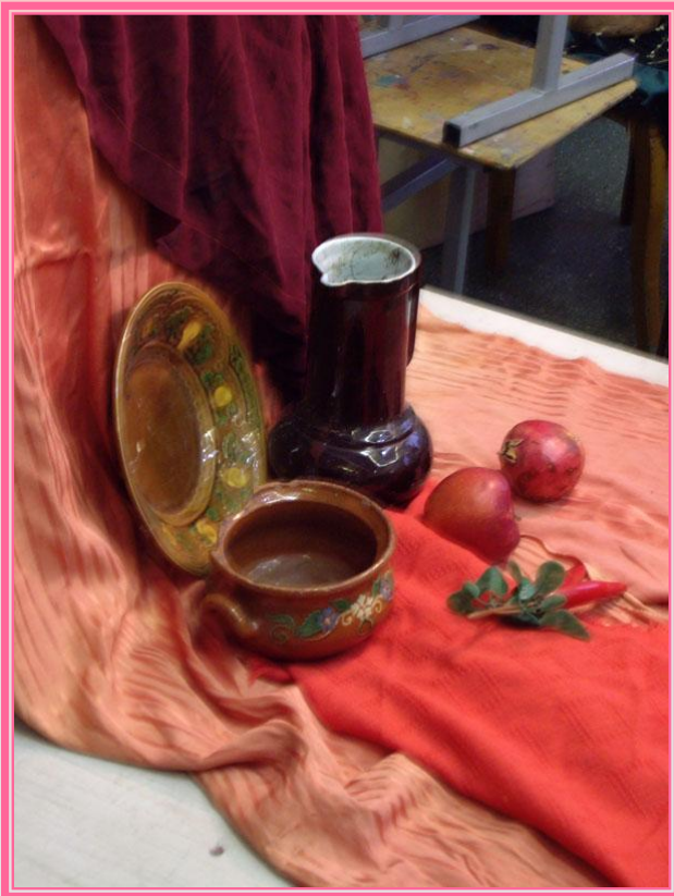
Красный натюрморт 2006