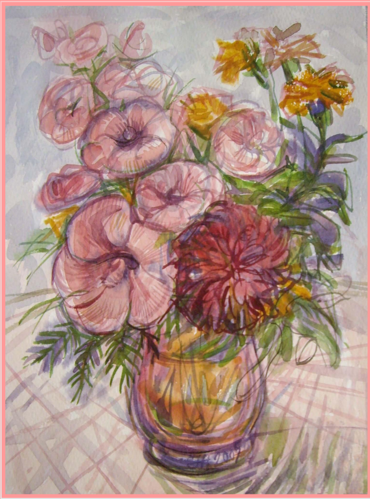
Осенний букет. Лаватеры.

В живописи акварельными красками можно использовать еще один метод, позволяющий использовать характер и динамику мазков кисти . Хотя в акварели мазки кистью не столь видны, как в работе масляными красками, они все равно активно применяются как интересный метод работы. Естественно, что разные кисти дают разные мазки, поэтому следует изучить технические возможности вашего набора кистей.