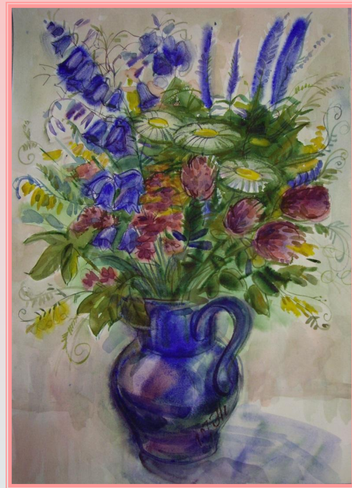
Полевые цветы. 2006г.