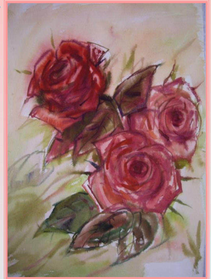
Летящие. 2006 г.

Акварель широко использовалась при создании архитектурных проектов, разработке планов городов, парков. В XIX в. художниками разных стран создано очень много акварельных работ, показывающих широкие возможности акварели как живописного материала.