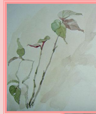
Комнатный цветок. 2004г.

Цвет каждой детали постановки берется сразу, в полную силу. Живопись выполняется в один слой.