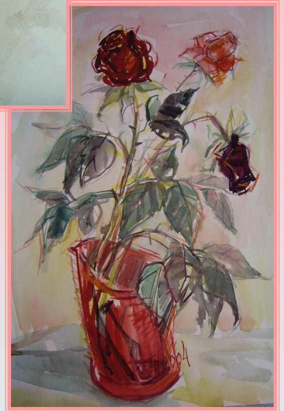
Розы сохнут. 2003