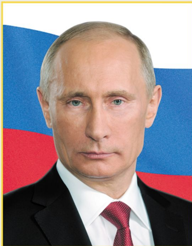
ПРЕЗИДЕНТ РОССИЙСКОЙ ФЕДЕРАЦИИ ВЛАДИМИР ВЛАДИМИРОВИЧ ПУТИН