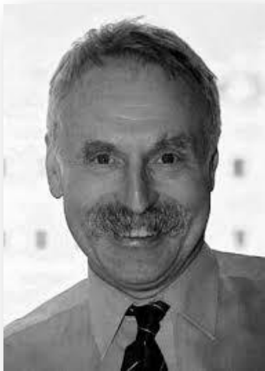
Блур Д. (д.р. 1942) Книга «Знание и социальное представление» (1976)