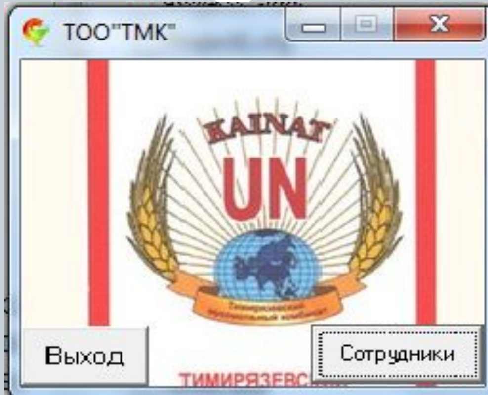
Рисунок. 1 Вид главной формы