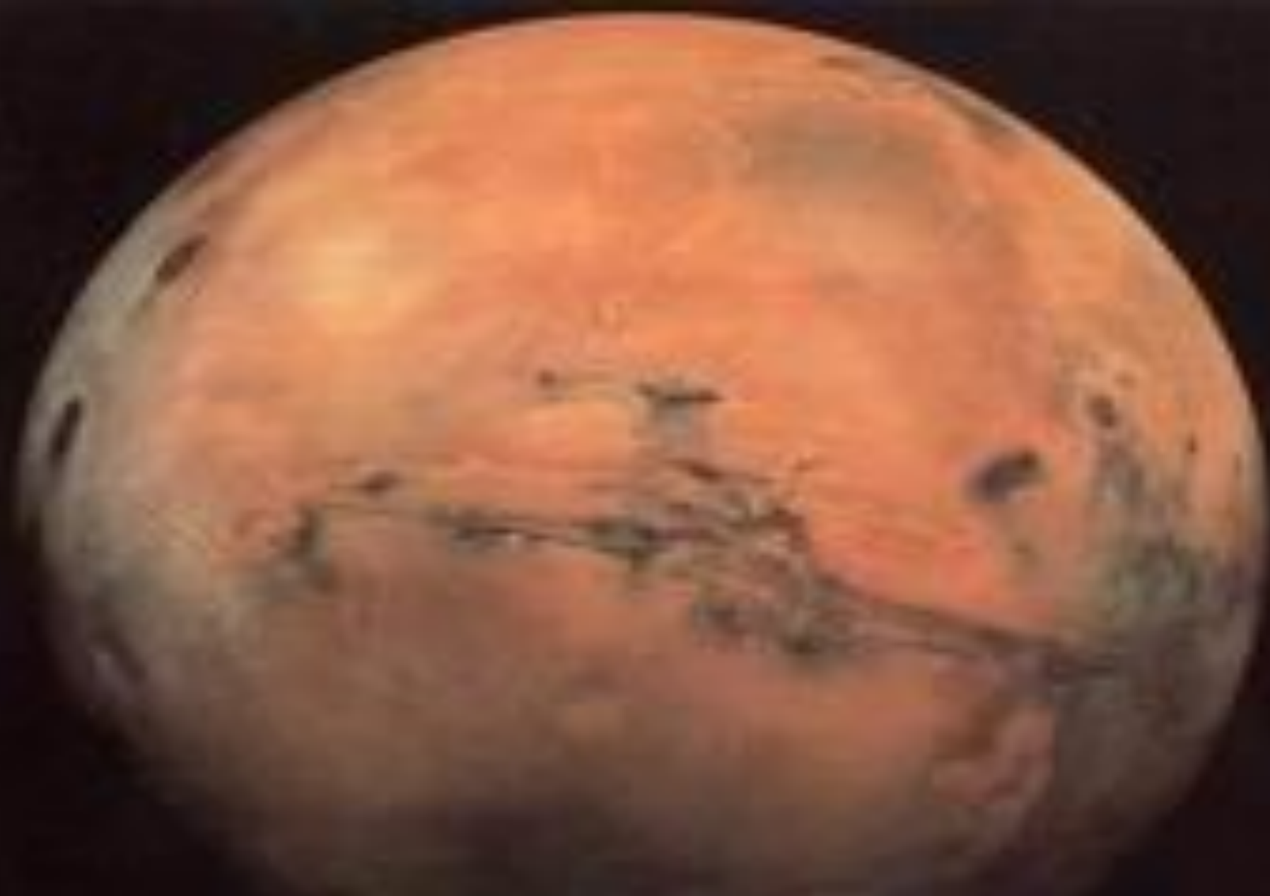
Марс- Пира (огненный, пламенный)