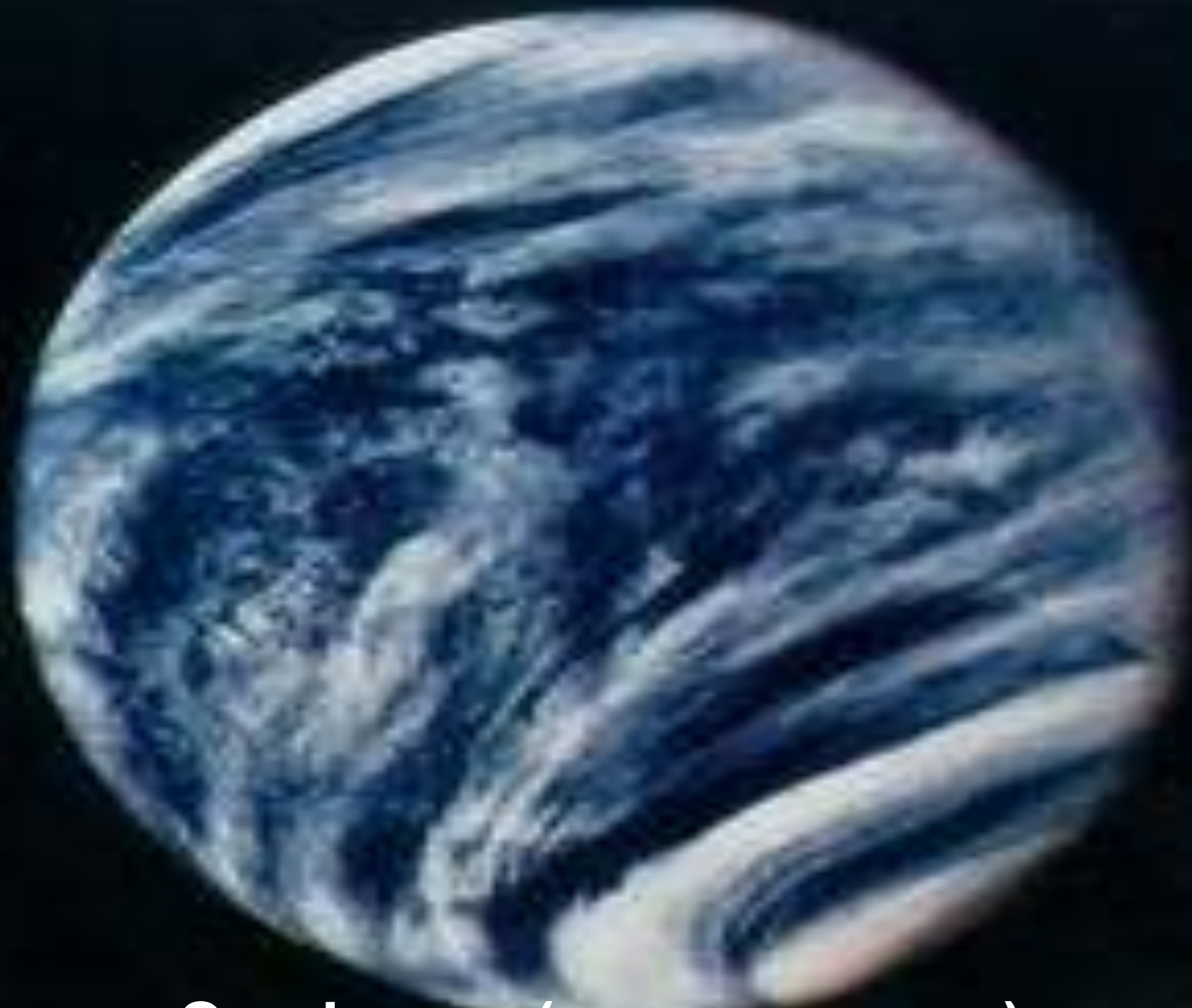
Венера - Эосфорос (несущая утро)