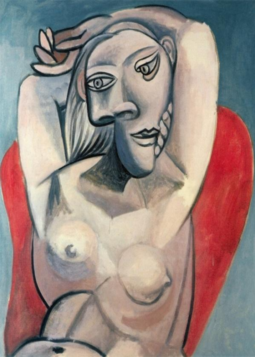
“Қызыл орындықтағы әйел” 1939 ж.

Мария-Терезаға ғашық болған сәттерінде Пикассо жан-тәнімен шығармашылыққа ден қойды. Оның мұндай көтеріңкі көңіл-күйі оның суреттерінен көрніс тапты. Бұл сәт қызының өмірге келгеніне дейін ғана жалғасты. Бұл Пикассо шығармашылығының шыңы десе артық айтқан емес.