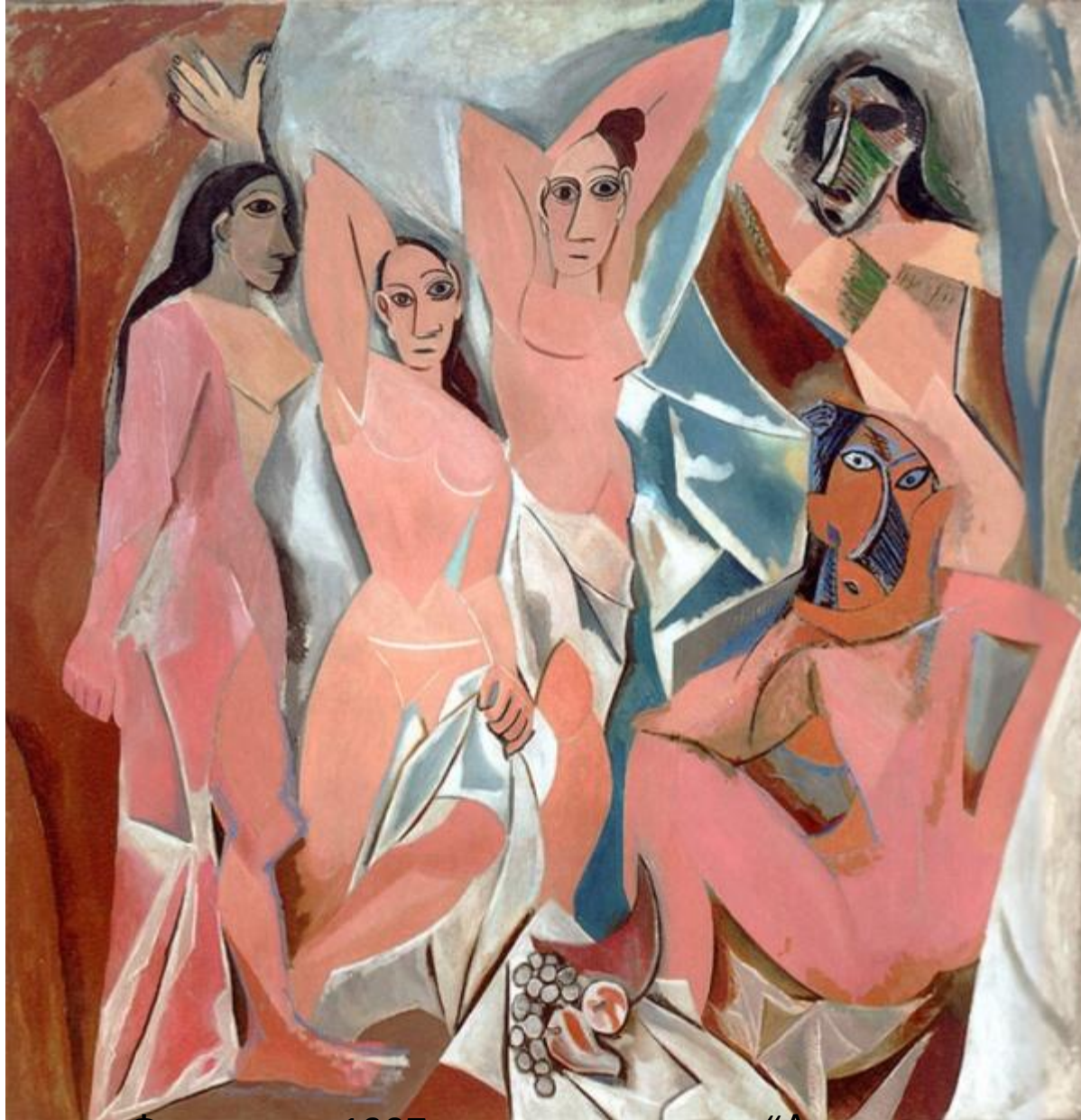
Фернанда 1907 жылы салынған “Авиньондық қыздар” атты Пикассоның Басты суретіне негіз болған.