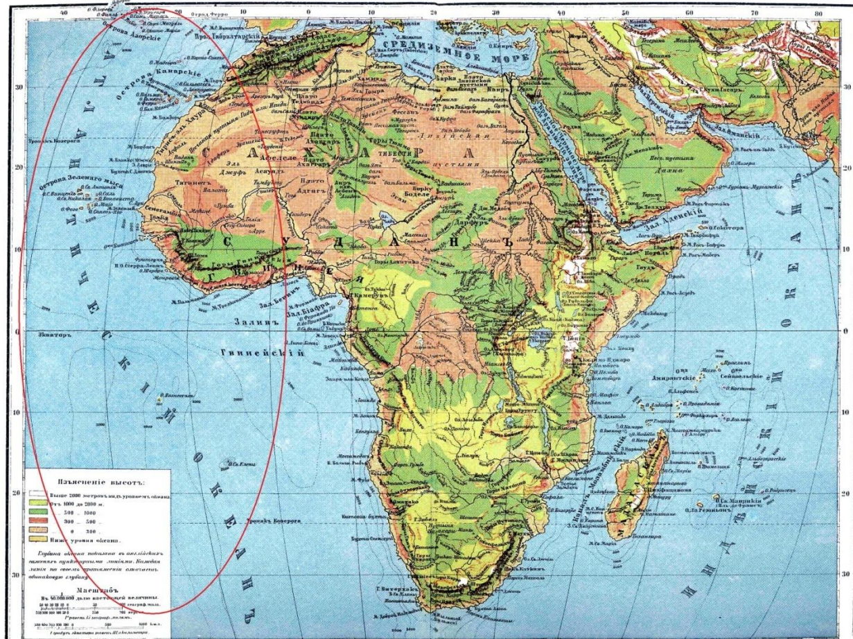
ФИЗИЧЕСКАЯ КАРТА АФРИКИ.