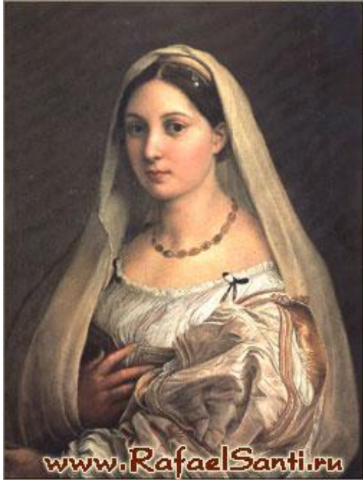
«Желбегей жамылған бикеш» шамамен 1514-1515.

Флоренциядағы Питти галериясындағы Рафаэльдің “ Донна Велата ” атты суреті көп уақытқа дейін құпия боп келді. Бұл Рафаэльдің өмірінің соңына дейін махаббаты болған Вазари болуы мүмкін деген болжамдар бар. Вазари Рафаэльдің “ Бөлішке сатушылар ” немесе “ Форнаридар ” (1515, Рим, Барберини сарайы) атты суреттерін позициялаған болатын. Аңыз желісі бойынша Рафаэль Тибр жағасында Маргарита Лути Атты наубайшының 17 жасар қызын модель болуға өзінің студиясына шақырған. Осылайша олардың арасында махаббат пайда болып, ол махаббат 6 жылға, яғни шебер өмірінің соңына дейін жалғасқан.