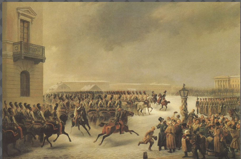
Восстание на сенатской площади