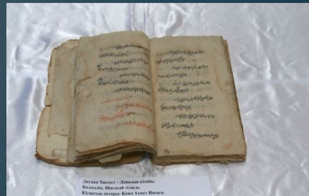
Диуани Хикмет - Давидов кітабы. Қолжазба, Шағалды тілі. Кітаптан алынды: Қожа Ахмет Йасауи.