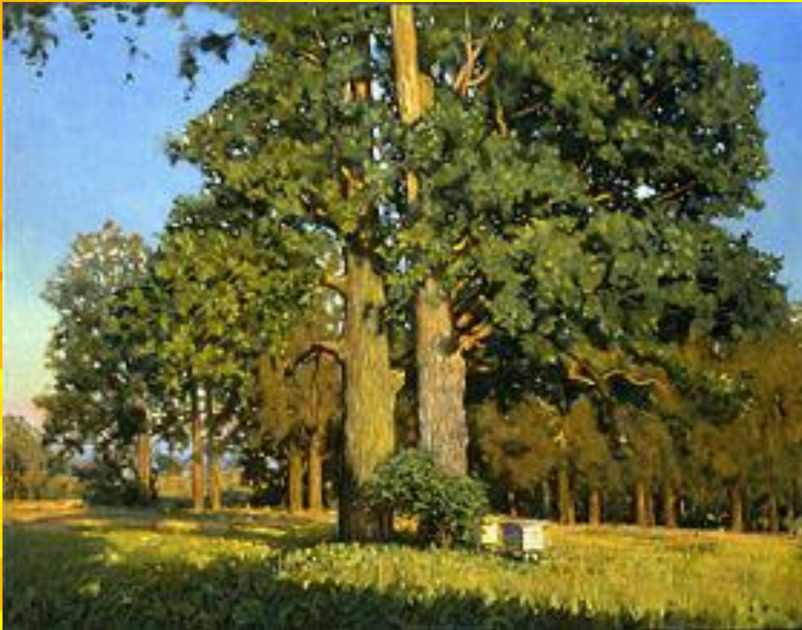
«Старые дубы», Николай Анохин, 1999 год.