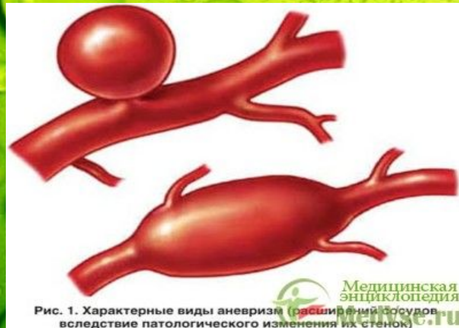
Рис. 1. Характерные виды аневризм (расширение сосудов вследствие патологического изменения их стенок)