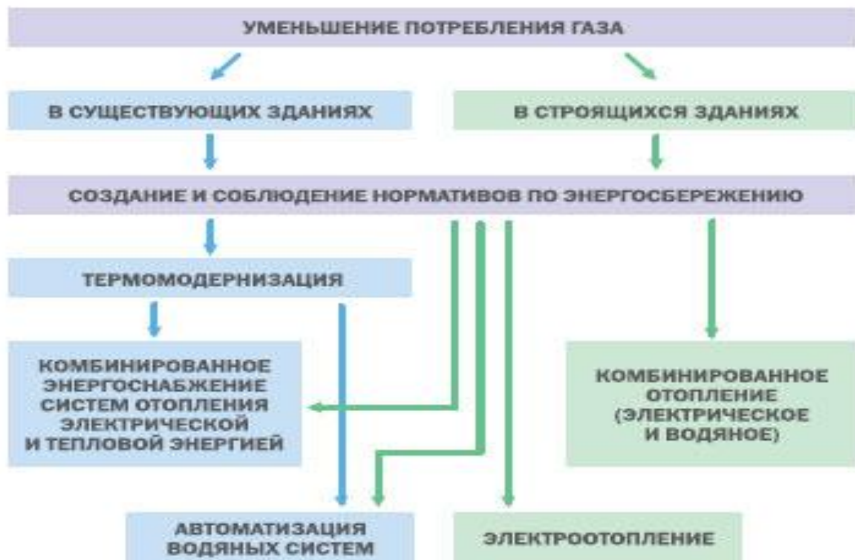
Рис. 1. Пути улучшения теплоснабжения зданий.