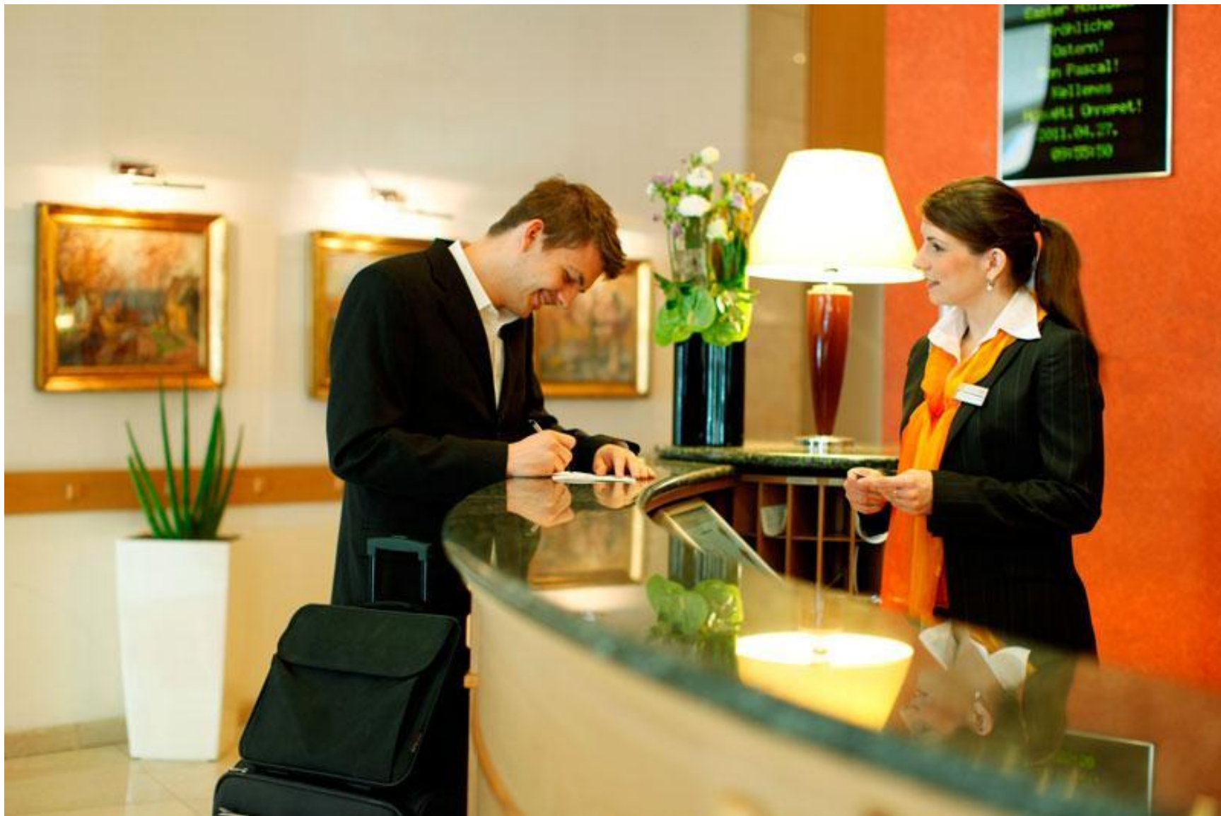
Продажа гостиничной услуги