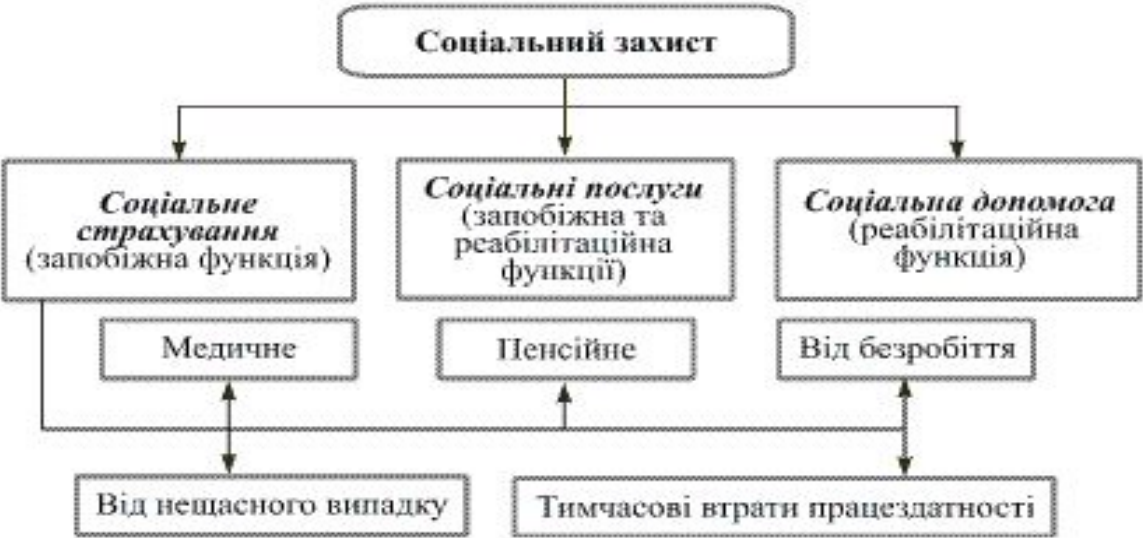
Рис.1. Структура соціального захисту.

Соціальний захист становить зміст соціальної функції держави і є системою економічних, юридичних, організаційних заходів щодо забезпечення основних соціальних прав людини і громадянина в державі. Це всі заходи держави, спрямовані на забезпечення її соціальної функції. У цьому аспекті елементи соціального захисту притаманні різним сферам суспільних відносин, у яких реалізуються соціальні права громадян, – сферам застосування праці, соціального страхування, соціальної допомоги, охорони здоров'я, освіти, житлової політики.