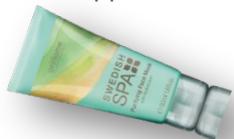
Очищающая маска Код 20372