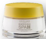
Крем для лица Код 23735