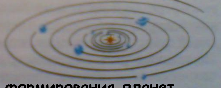
Важнейшие этапы формирования планет.