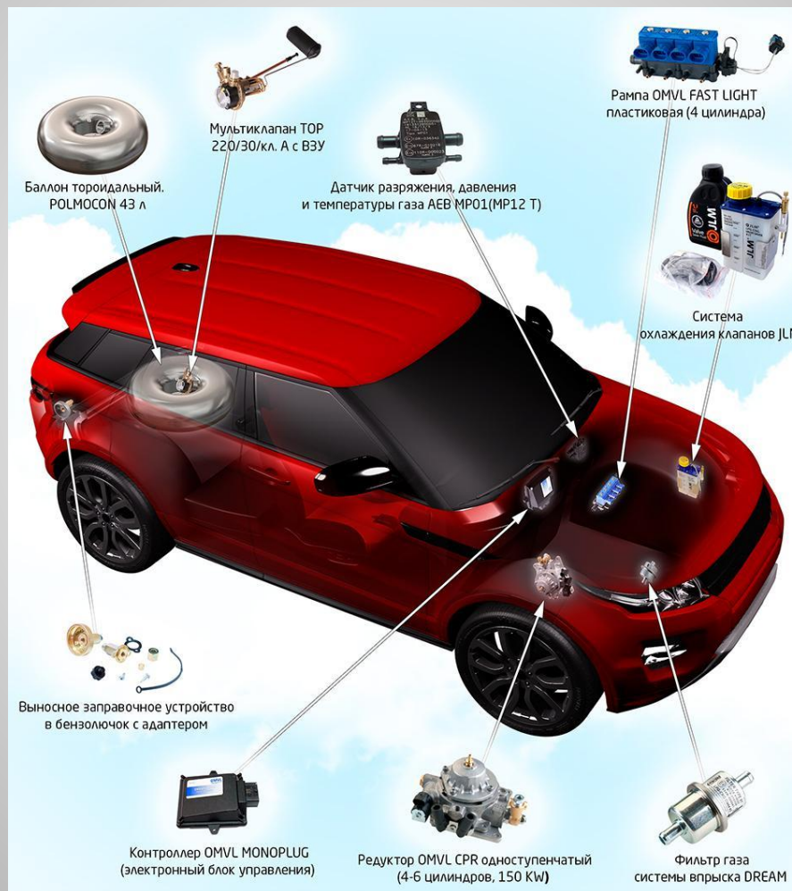
Схема газобаллонного оборудования наиболее распространенного четвертого поколения