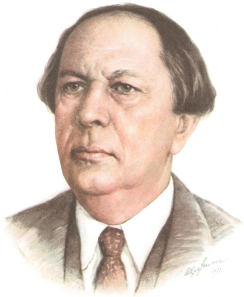
Алексей Николаевич Толстой (1883—1945)