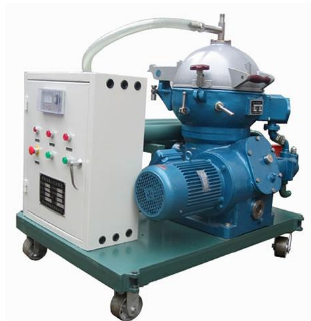
Установка для очистки центробежных фильтров