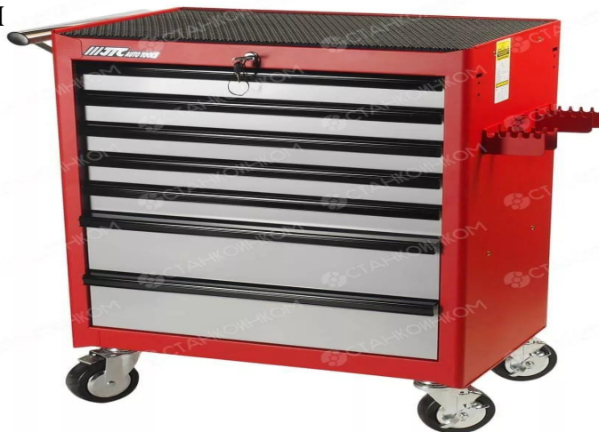
Тележка с набором инструментов для ремонта авто