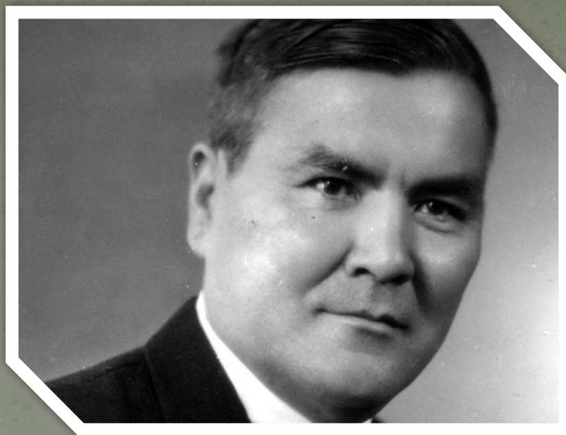
Ермухан Бекмаханович Бекмаханов