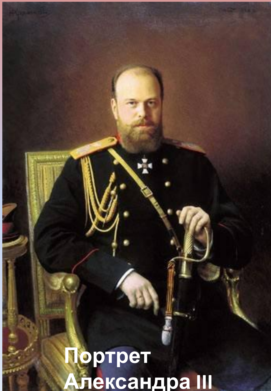
Портрет Александра III