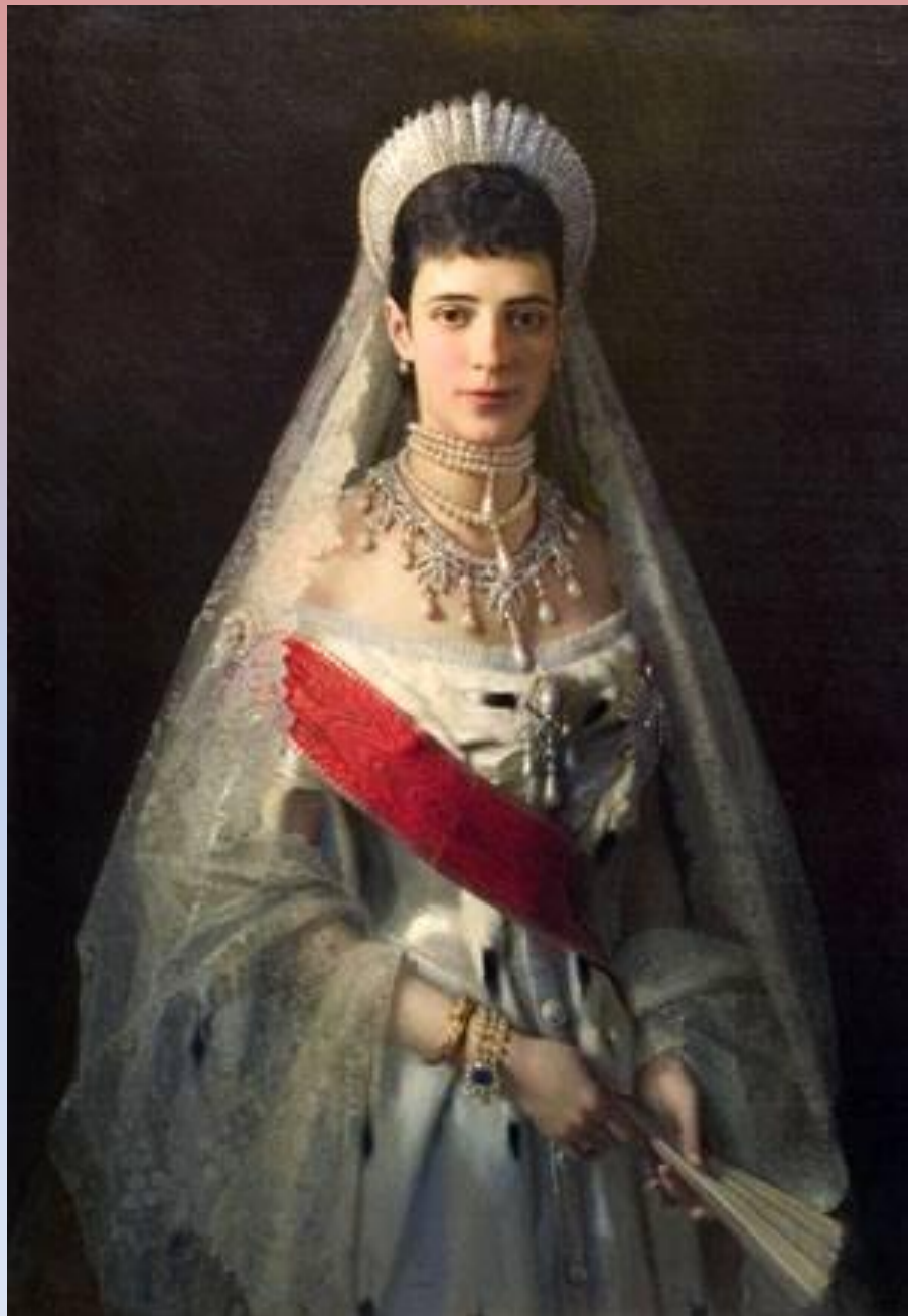
Портрет императрицы Марии Федоровны