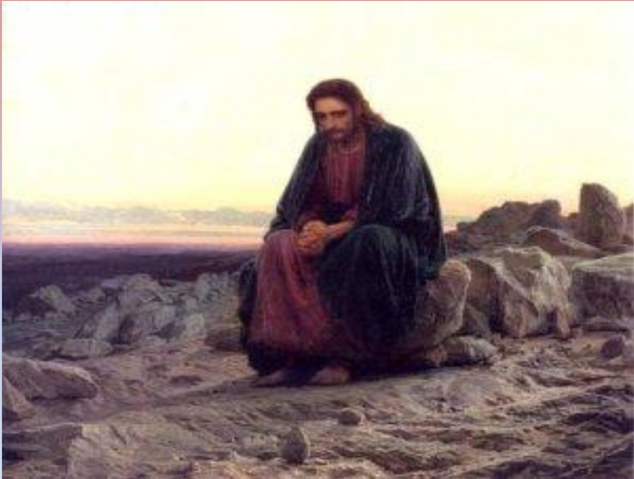
Христос в пустыне. (1872)