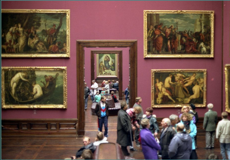
Alte Meister Galerie.