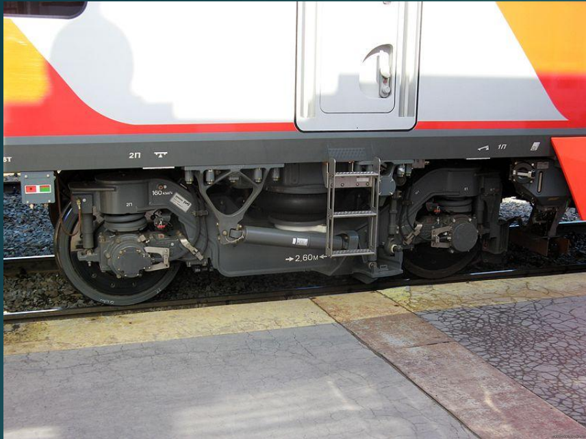
Моторная тележка головного вагона ЭС1