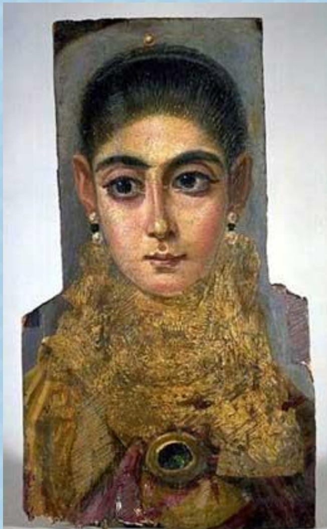
ПОРТРЕТ АНТИЧНОЙ ЖЕНЩИНЫ. Воск. Дерево