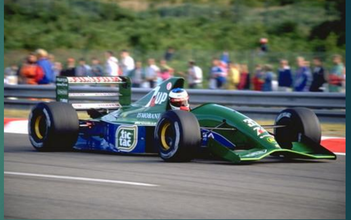
Jordan 191 Дебют – 1991 г