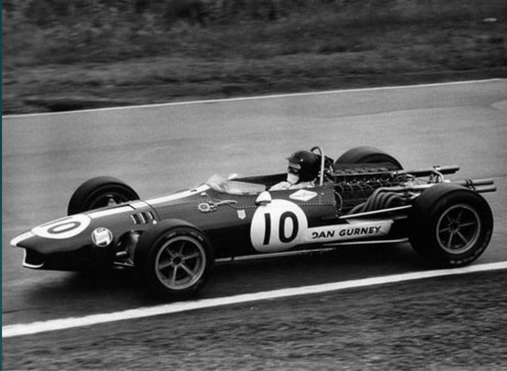
Eagle T1G Дебют – 1966 г