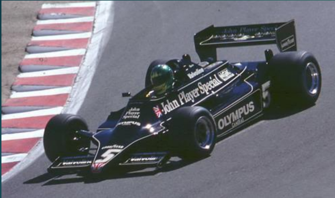
John Player Special