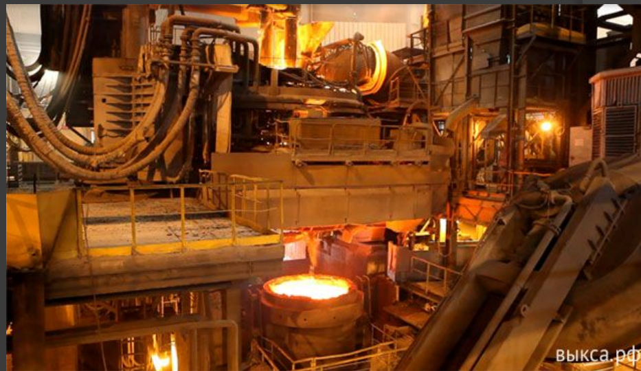
Рис 2: ЛПК увеличил объём производства горячекатаного рулонного проката на 8%