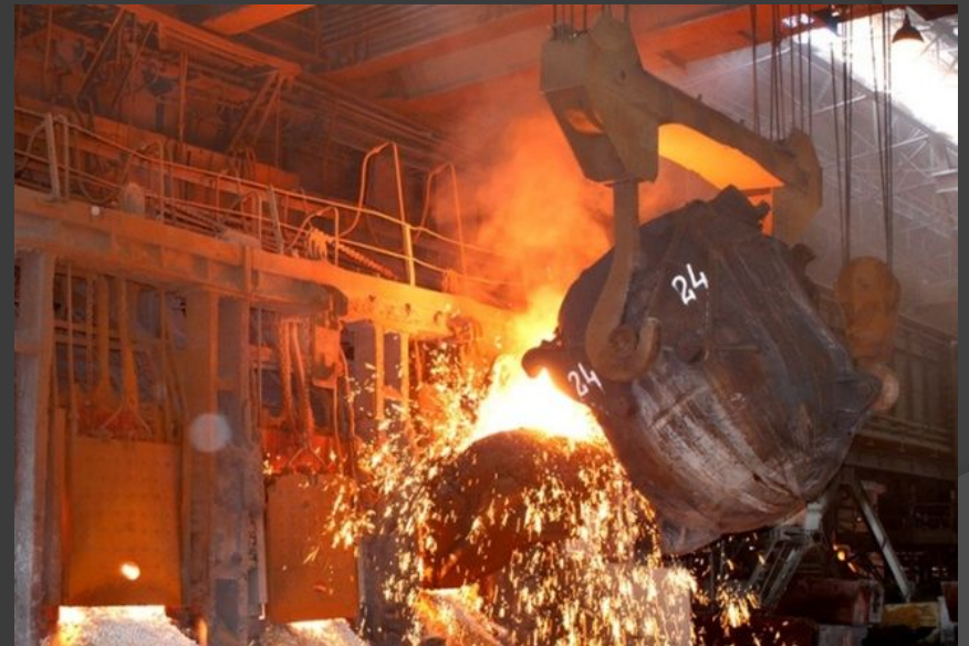
Рис. 2 : ММК разработал технологию восстановления железа из титаномагнетитовых руд