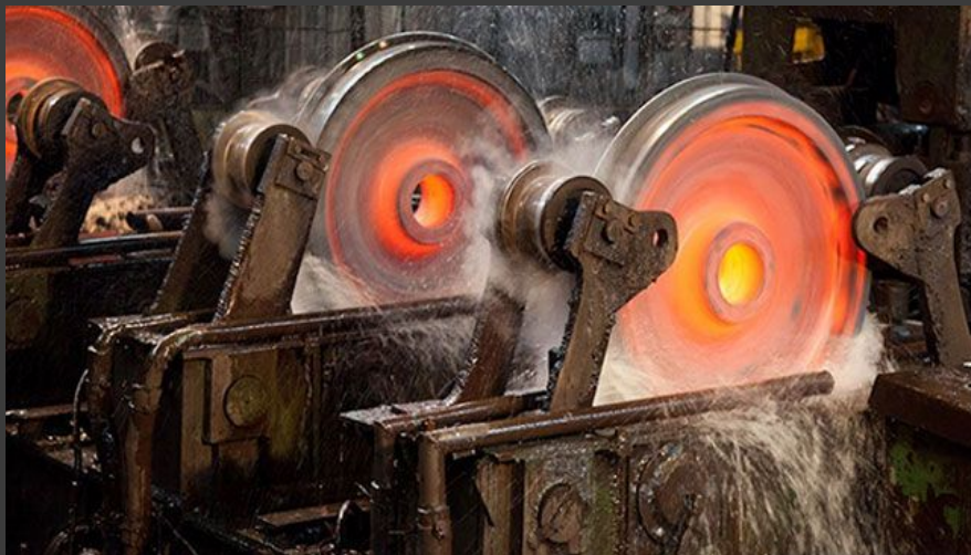
Рис 1: Успешно освоено производство колес диаметром 863 и 866 мм из непрерывно литой заготовки диаметром 525 мм для электропоездов и облегченного метрополитена.