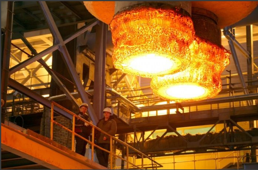
Рис.1 : ММК освоил выпуск высокопрочных сталей MAGSTRONG (Магнитские высокопрочные)