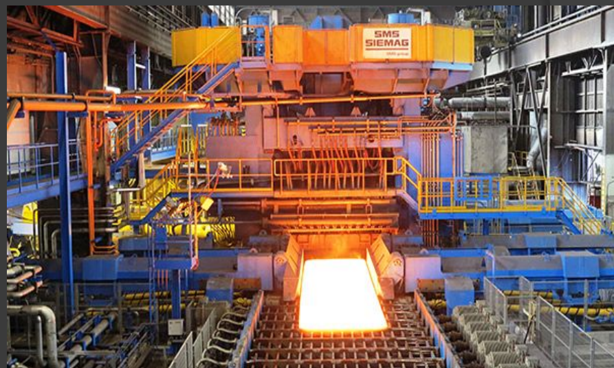
Рис 2: ММК реализует проект строительства нового АНГЦ