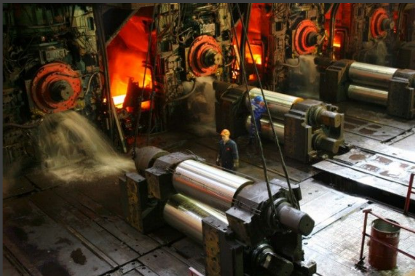
Рис 1: Разработана новая технология производства листового проката