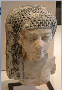
Дочь Нефертити (18 династия Египта)

Скульптура — вырезаю, высекаю — ваяние, пластика — вид изобразительного искусства, произведения которого имеют объёмную форму и выполняются из твёрдых или пластических материалов — в широком значении слова, искусство создавать из глины, воска, камня, металла, дерева, кости и других материалов изображение человека, животных и иных предметов природы в осязательных, телесных их формах