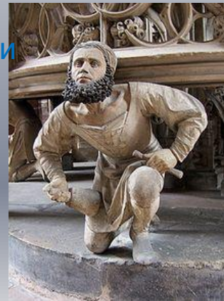
Скульптура из церкви святого Лоренцо