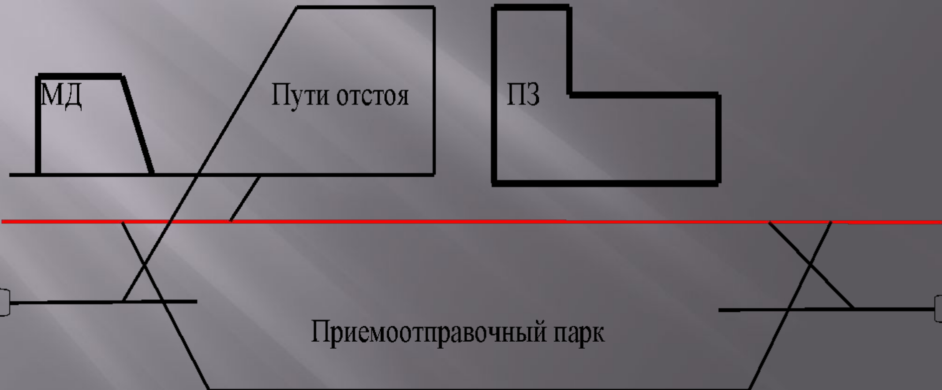
Схема пассажирской станции Пятилетка