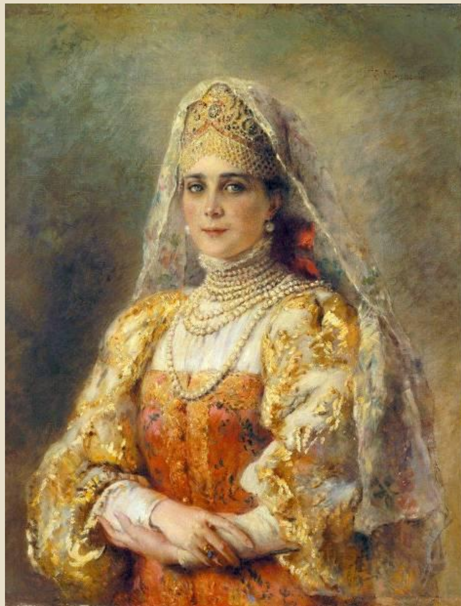
К. Е. Маковский Портрет княгини З. Н. Юсуповой в русском костюме