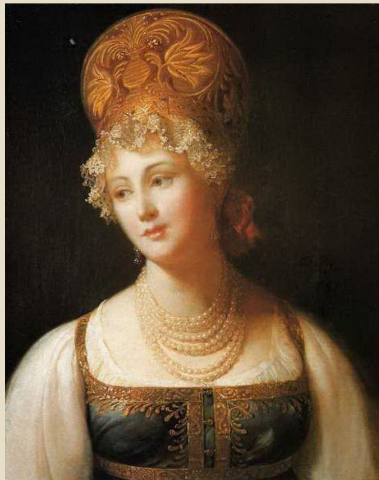
П. Барбье Портрет молодой женщины в русском сарафане