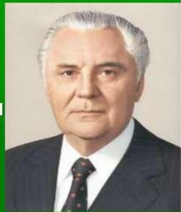
Щербицький - перший секретар ЦК КПУ у 1972 – 1989 рр.