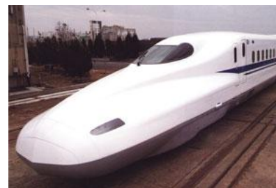
Опытный электропоезд 994. Головной вагон с обтекаемой носовой частью