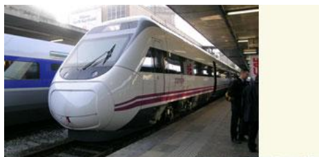
Электропоезд AVE S120 ATPRD (общий вид и колесная пара с переменным положением колес на оси), Испания