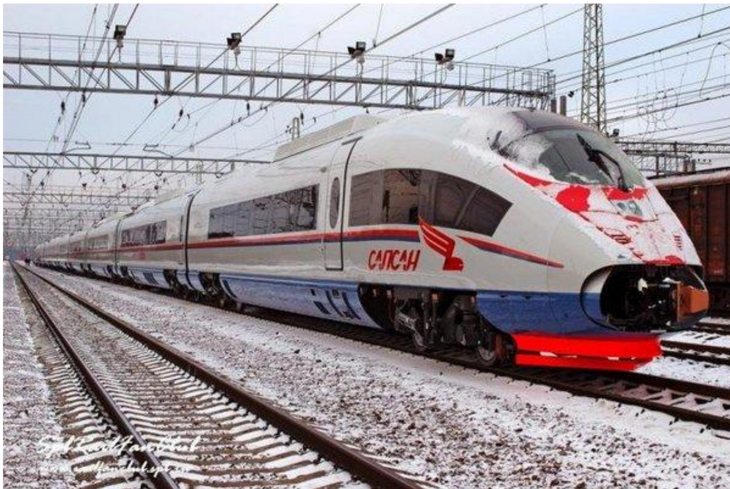
Первый в России высокоскоростной поезд "Сапсан»