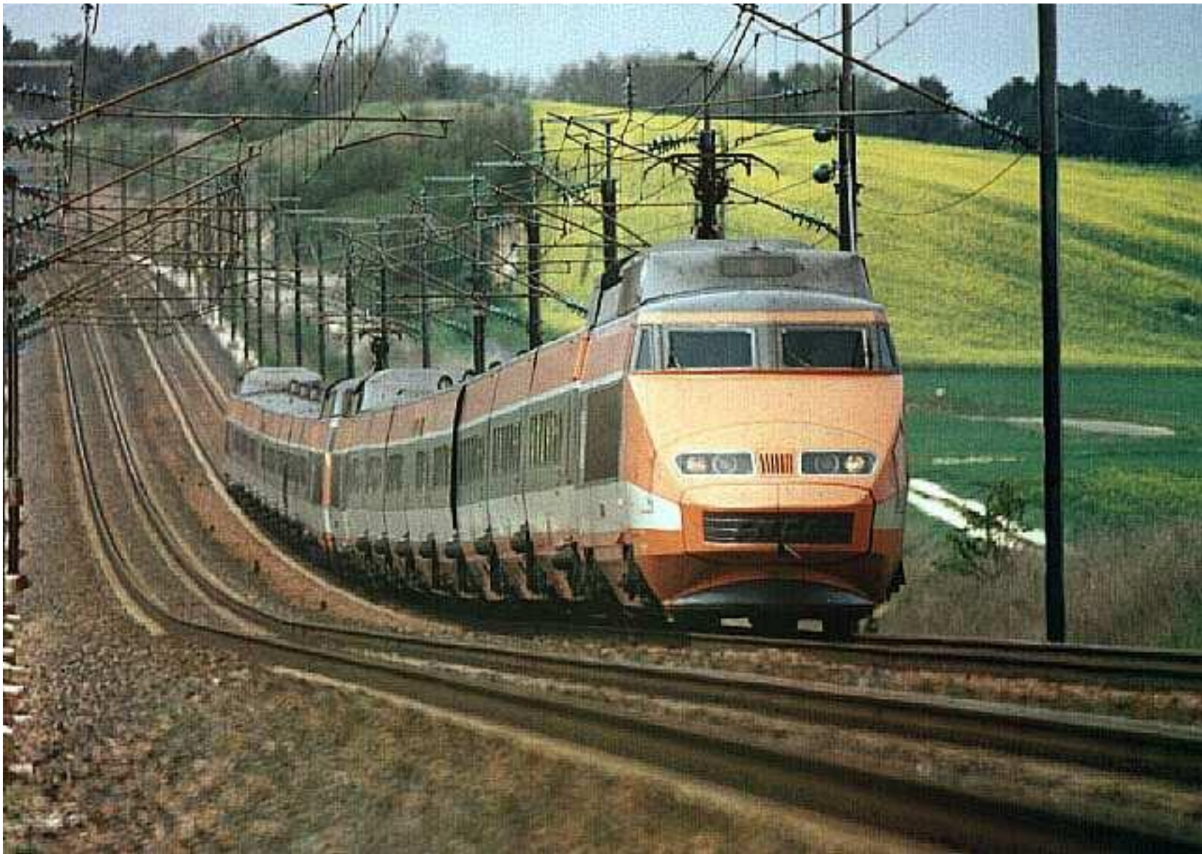
Высокоскоростной поезд TGV