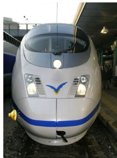
Электропоезд AVE S103 Velaro E