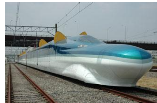
Опытный электропоезд 994. Головной вагон со стрелевидной носовой частью