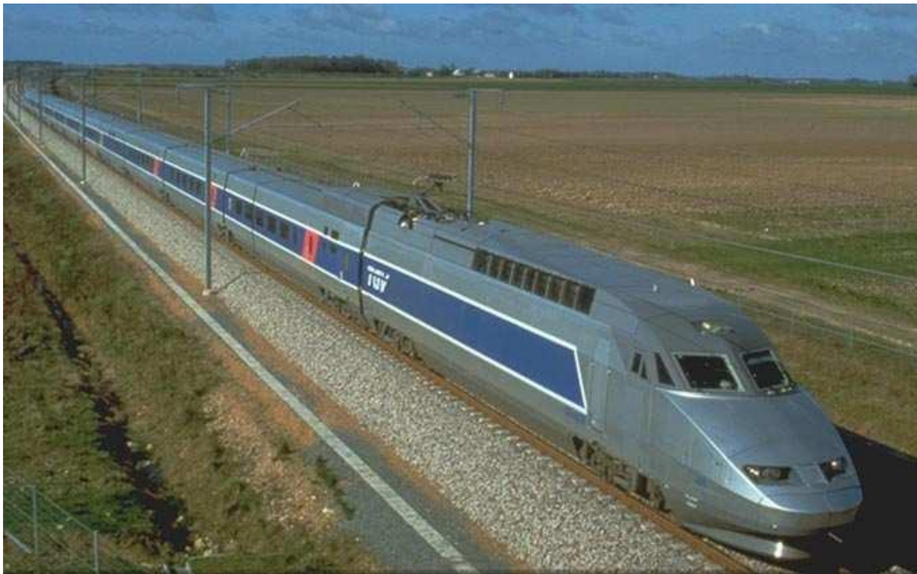
Высокоскоростной поезд TGV