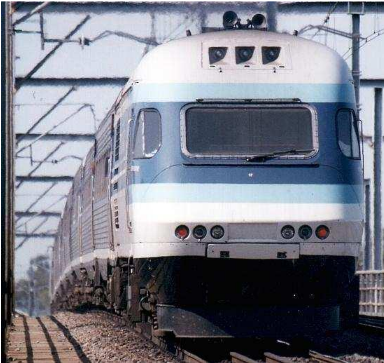
Высокоскоростной поезд ХРТ