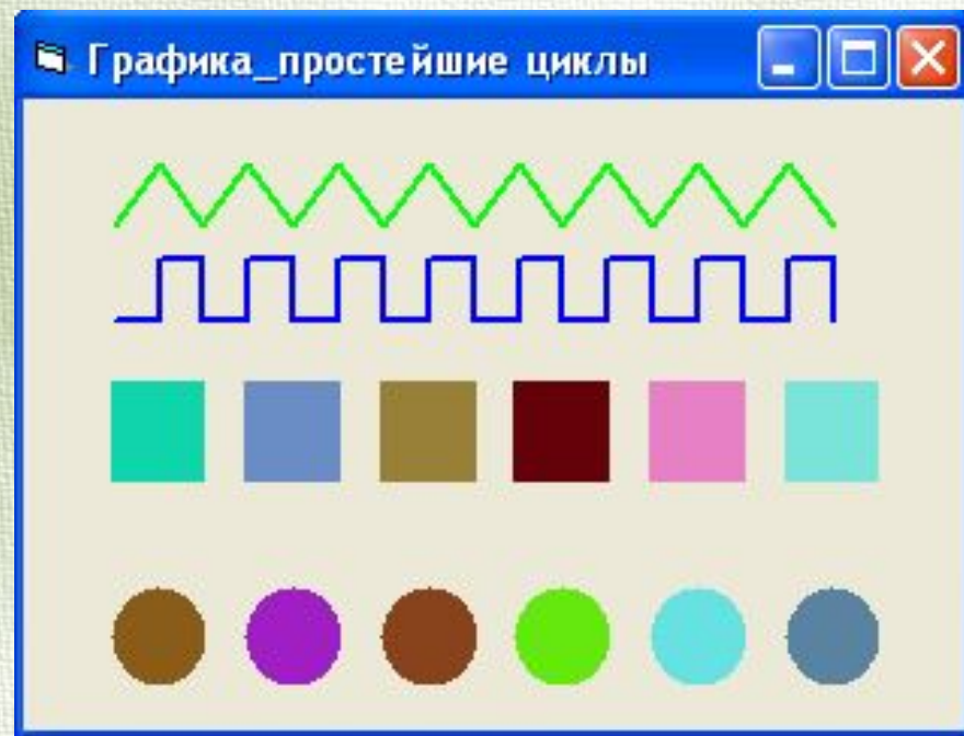
Рис.1. Образец циклических композиций

С помощью цикла можно создать повторяющиеся узоры (рис.1), эффект движения, выполнить расчеты по таблицам и многое другое.